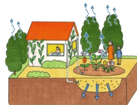
▼イメージ図（個人宅等）